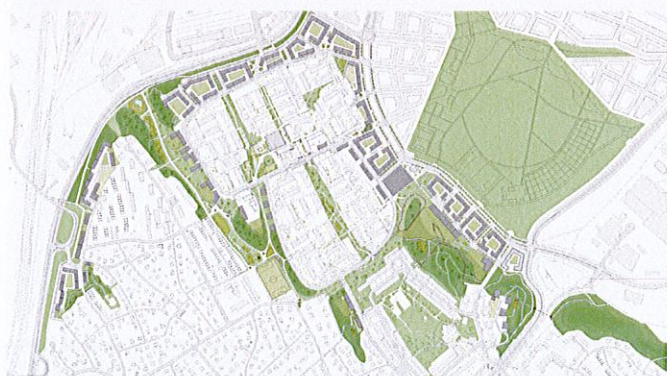
Illustration: SWMS arkitektur